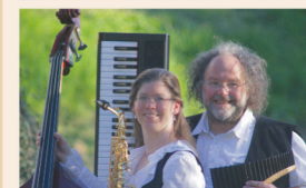
WindWood & Co.