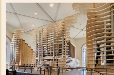
Die „Queen an der Werra“

mit Orgelwerken von F. Mendelssohn und J.G. Rheinberger zum 215. und 180. Geburtstag mit Kantor Maximilian Göllner und Pfarrer Hubertus Spill