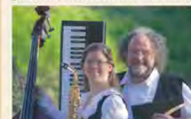
WindWood & Co.