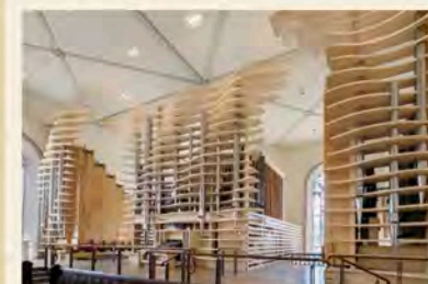
Die „Queen an der Werra“

„Romantik pur“ Musikalischer Gottesdienst mit Orgelwerken von F. Mendelssohn und J.G. Rheinberger zum 215. und 180. Geburtstag mit Kantor Maximilian Göllner und Pfarrer Hubertus Spill